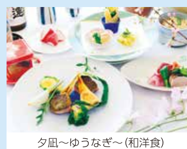
夕凧～ゆうなぎ～(和洋食)