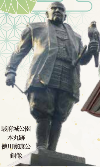
駿府城公園 本丸跡 徳川家康公 銅像