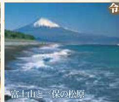
富士山と三保の松原