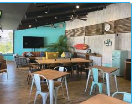
ワーケーションルーム THE SURF SHACK